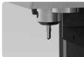
금속 각인 전용 공구 지원