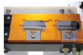
군인 인식표 지그